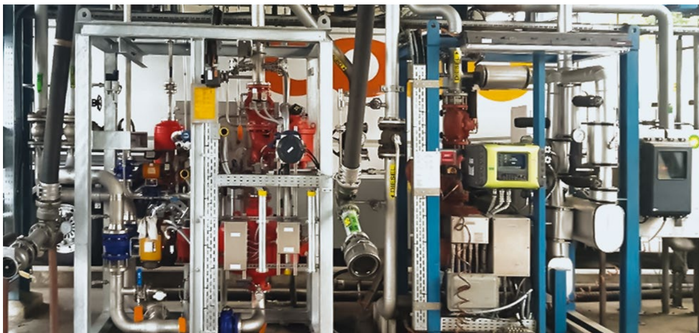
Blending Skid von INRAG

Bioethanol im Tank hilft bei der CO 2 -Einsparung und reduziert die Kosten für die Mineralöl-Unternehmen. Die Kostensenkung resultiert aus dem günstigen Einkaufspreis für Bioethanol, da dieser von der Mineralölsteuer befreit ist. Die Gesamtkosten für den „Bio-Sprit“ sind somit geringer als für „reine“ Mineralölprodukte. Umfragen haben ergeben das schon mehrere Mineralöl-Unternehmen in der Schweiz auf die Beimischung von Ethanol setzen. Für die steigende Nachfrage sorgen auch die Schweizer Klimapolitik und das CO 2 -Gesetz. Letzteres verlangt von den Treibstoff-Importeuren bis 2020 zehn Prozent der CO 2 -Emissionen, die sie im Verkehr verursachen, mit Klimaprojekten im Inland zu kompensieren. Das Bundesamt für Umwelt bewilligte, dass die Mineralöl-Unternehmen für ihren Einsatz von importiertem Ethanol, Emissions-Reduktionsbescheinigungen erhalten. Das heisst: Mit dem Ethanol können sie sich teure Einkäufe von Emissions-Bescheinigungen sparen.